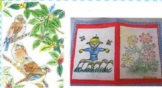
【塗り絵】 サンホームふじみ(ショートステイ)利用者