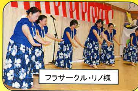
フラサークル・リノ様