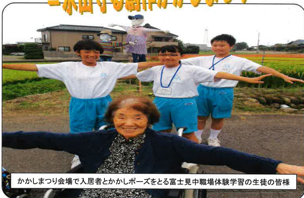
かかしまつり会場で入居者とかかしポーズをとる富士見中職場体験学習の生徒の皆様