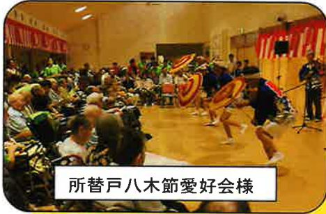
所替戸八木節愛好会様