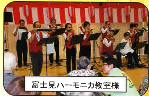
富士見ハーモニカ教室様