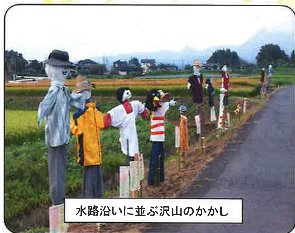
水路沿いに並ぶ沢山のかかし