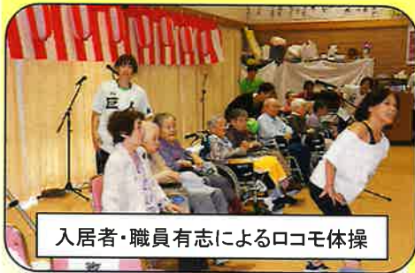
入居者・職員有志によるロコモ体操