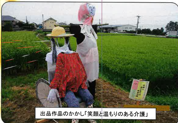
出品作品のかかし「笑顔と温もりのある介護」