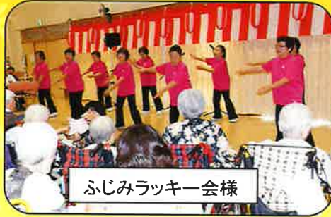
ふじみラッキー会様