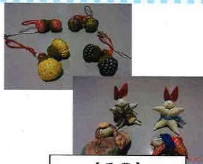
【手芸】 第2デイ利用者