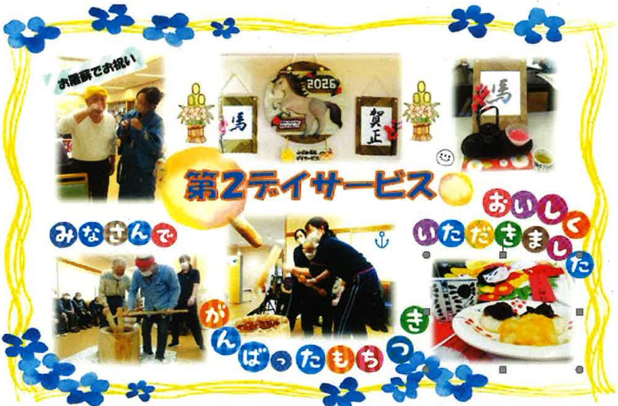
(第2デイサービス 神成 記)