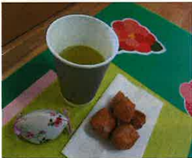
ベーカリーなかまのお菓子と静岡のお茶です。