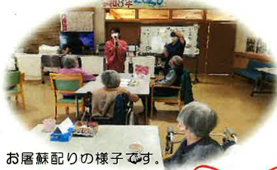
お屠蘇配りの様子です。