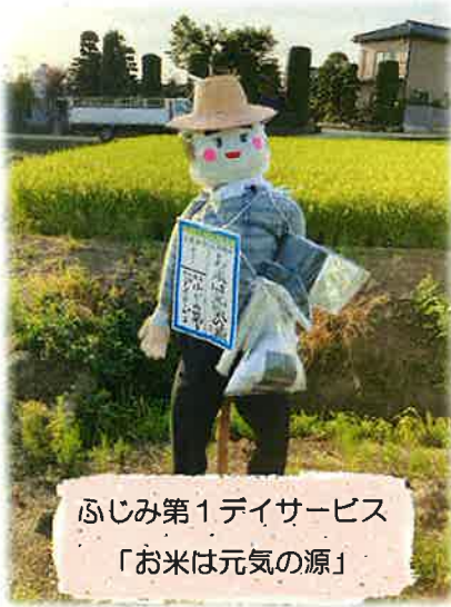
ふじみ第1デイサービス 「お米は元気の源」