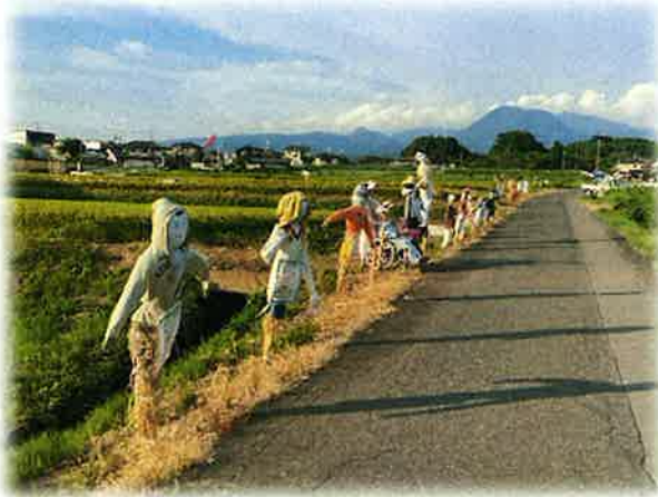
赤城大沼用水土地改良区 かかしまつり