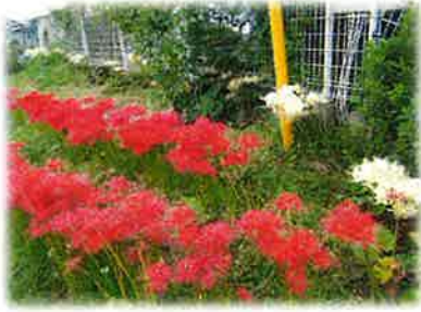
敷地内の彼岸花が今年も綺麗に咲いてくれました。