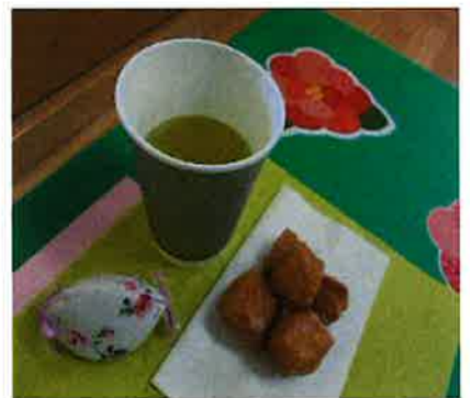
包括北部 佐野 記

開始から約50分、書き上がった方で、比叡山延暦寺へ納経希望の方は、二千元を添えて珊瑚寺さんへ納められました。