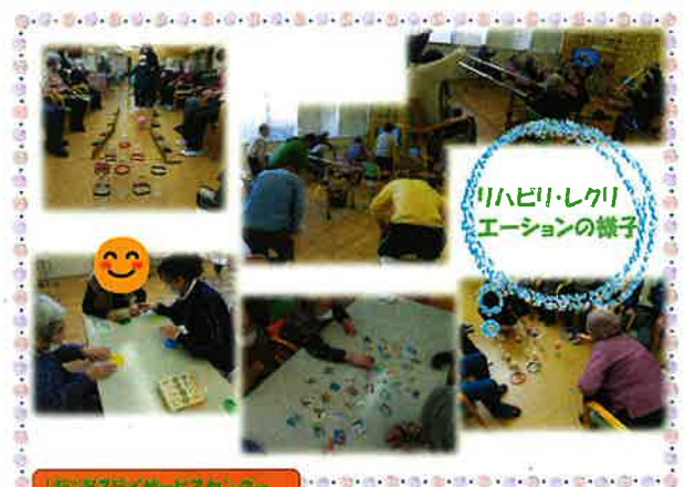
第2デイ 黒崎 記

【新】第2デイサービスの様子 第2デイサービスでは、主にスタンディングリハビリや小集団リハビリ、レクリエーションを行っています。皆さんリハビリ後は「疲れた!」と発言が聞かれるほど意欲的に励まれています。また、「足がしっかりとってきた」「体が楽になった」と笑顔も見られます。 引き続き、一丸となってリハビリを行い、健康な人生100年時代を目指していきたいと思えます。