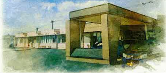
ブラウンとピンクの外観が目印です。