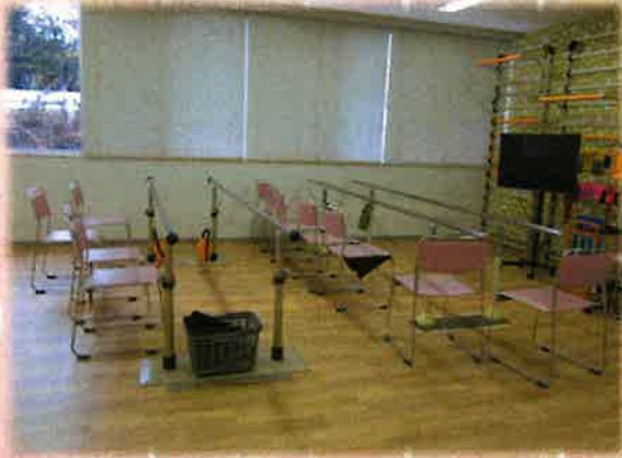
リハビリルームで作業療法士と一緒に頑張ります♪