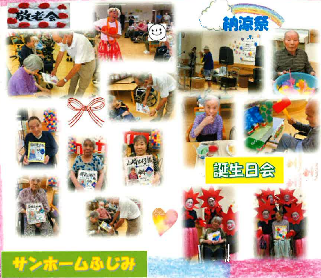
(サンホームふじみ 小堀記)

夏の風物詩流しそうめん ふじみのさとは、季節の行事として、昼食時に流しそうめんを行いました。職員の合図で竹にそうめんを流し、入居者様にすくっていただき美味しく楽しんでいただきました。