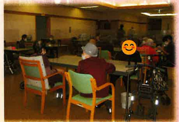
タイトル 「一緒に幸せだね」

毎年、赤城大沼用水土地改良区様主催の「かかしまつり」にかかしを出展させていただいていますが、今回も第1ティサービスの職員と利用者様が頑張って作って下さいました。孫と犬と仲良く過ごしているシーンで、家族と過ごせることの大切さや幸せな気持ち表現できている作品になりました。