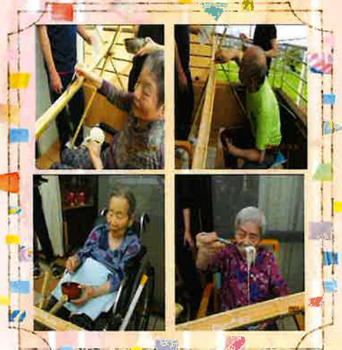
(ふじみのさと 山口記)

餃子の皮で手作りピザ おやつ時間に手作りピザを作りました。それぞれ好きな具材と種から育てたバジルをのせてオリジナルピザを作りました。「美味しかった」と好評でした。