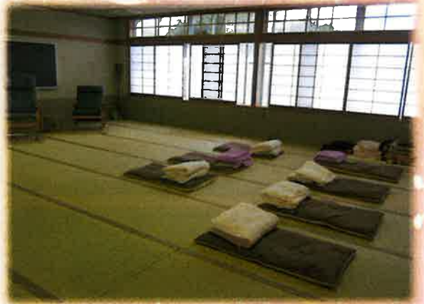
畳の部屋でリラックスしながら休憩することができます。