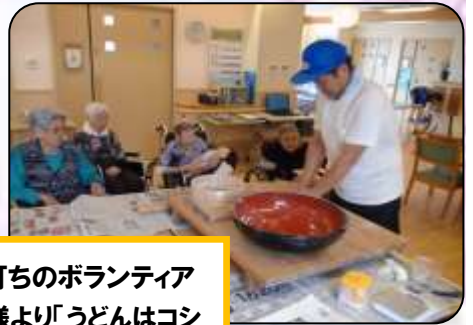
うどん打ちのボランティア 入居者様より「うどんはコシ が大事」と、うどんを打つ手 に力が入ります