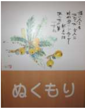
▲ 浅見様制作のオリジナル表札