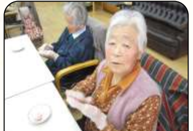
ひなまつり ご飯を使った桜餅づくり