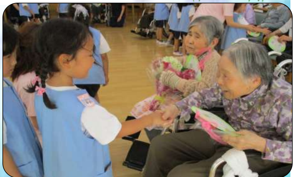
▲ 園児よりメッセージカードを頂き、満面の笑顔で握手する入居者