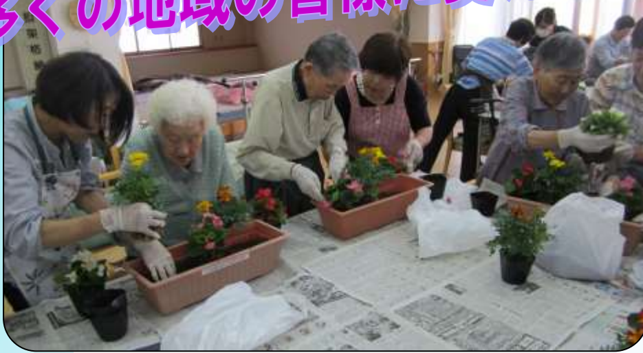
▲ JA 女性部の皆様と真剣になって花苗を植え込む利用者