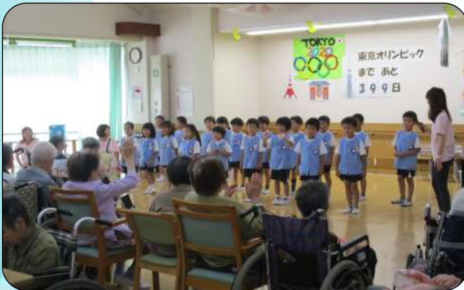
▲ 毎年、紫陽花の咲く頃訪れて下さる富士見幼稚園児

当施設は、いつも地域の方々が大勢訪れて下さいます。初夏を思わせる日和の5月23日(木)には、JA前橋市富士見地区女性部の皆様。今を盛りと咲く紫陽花の花が見頃となった6月21日(金)は、富士見幼稚園児と保護者が訪れ、特養ホール内には、満面の清々しい笑顔があふれていました。